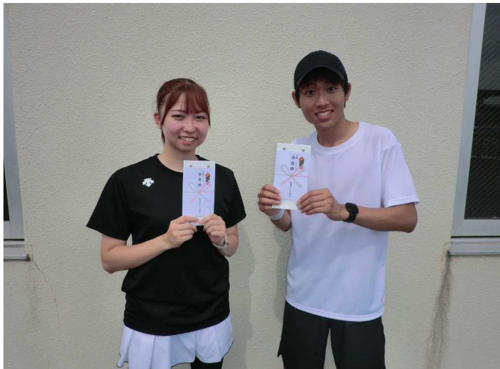
MIXダブルスA級 準優勝