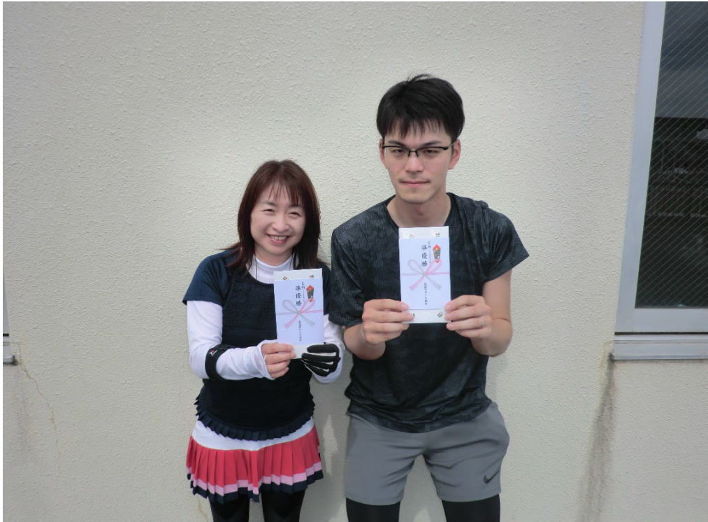
MIXダブルスC級 準優勝