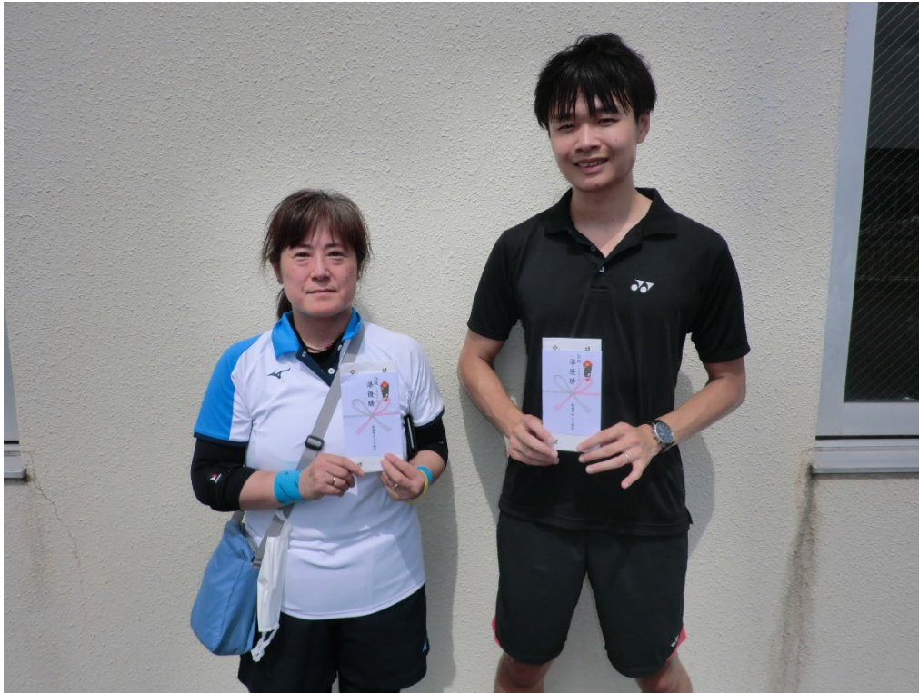
MIXダブルスD級 準優勝